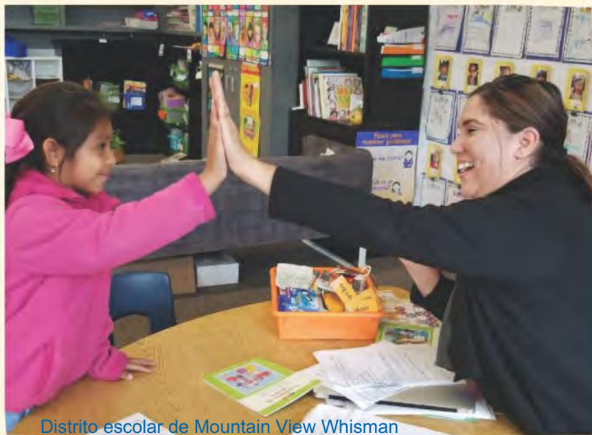
Distrito escolar de Mountain View Whisman