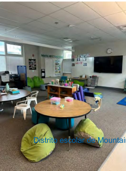
Distrito escolar de Mountain View Whisman