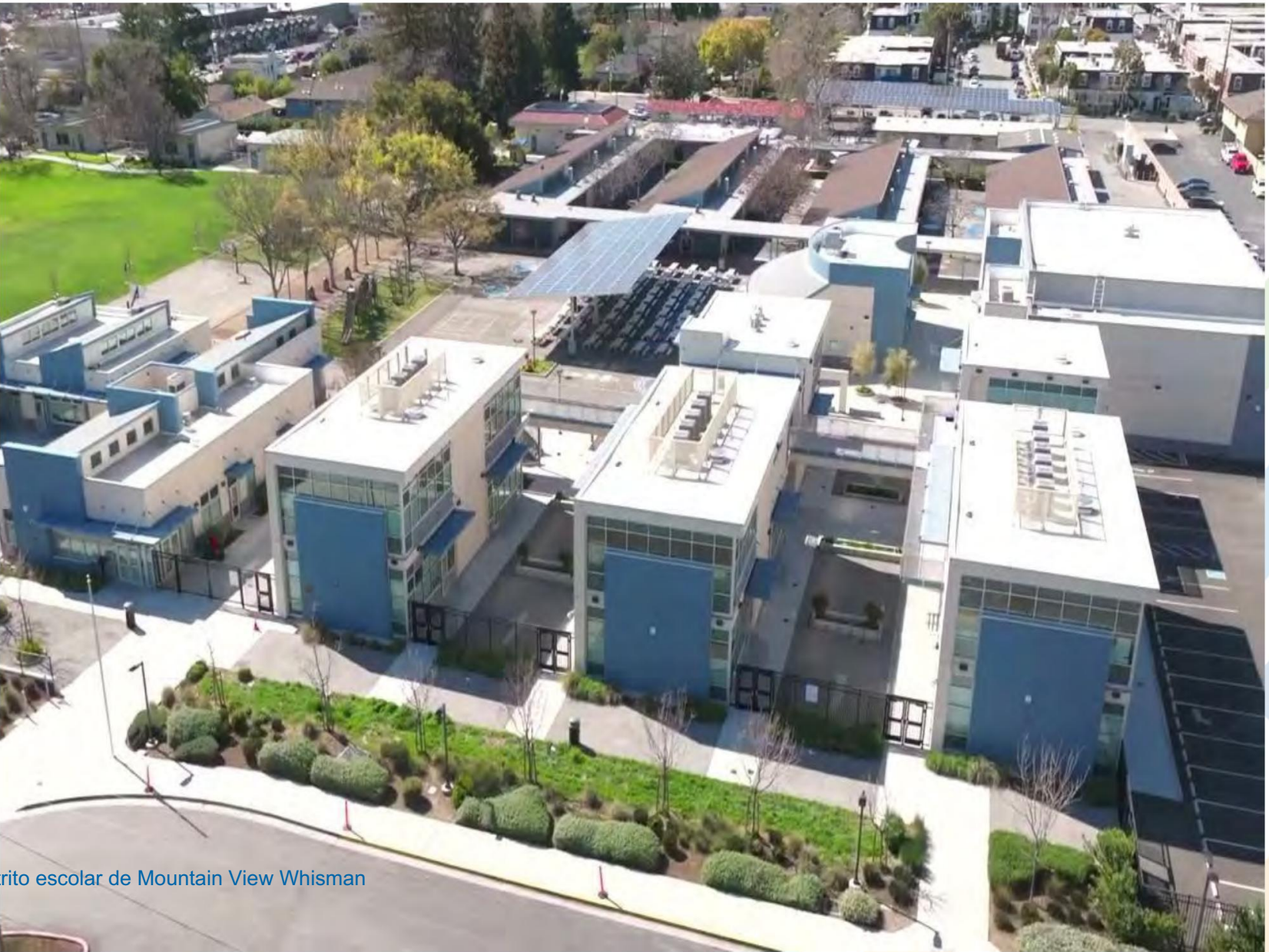
Distrito escolar de Mountain View Whisman